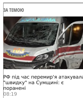
РФ під час перемир'я атакувала "швидку" на Сумщині: є поранені 08:19

Росіяни завдали авіаударів, зокрема по району населеного пункту Підгаврилівка у Дніпропетровській області, на Запоріжжі від авіаударів постраждали Воздвижівка, Цвіткове, Копані, Чарівне, Рівне, Обще, Омельник, а також місто Херсон.