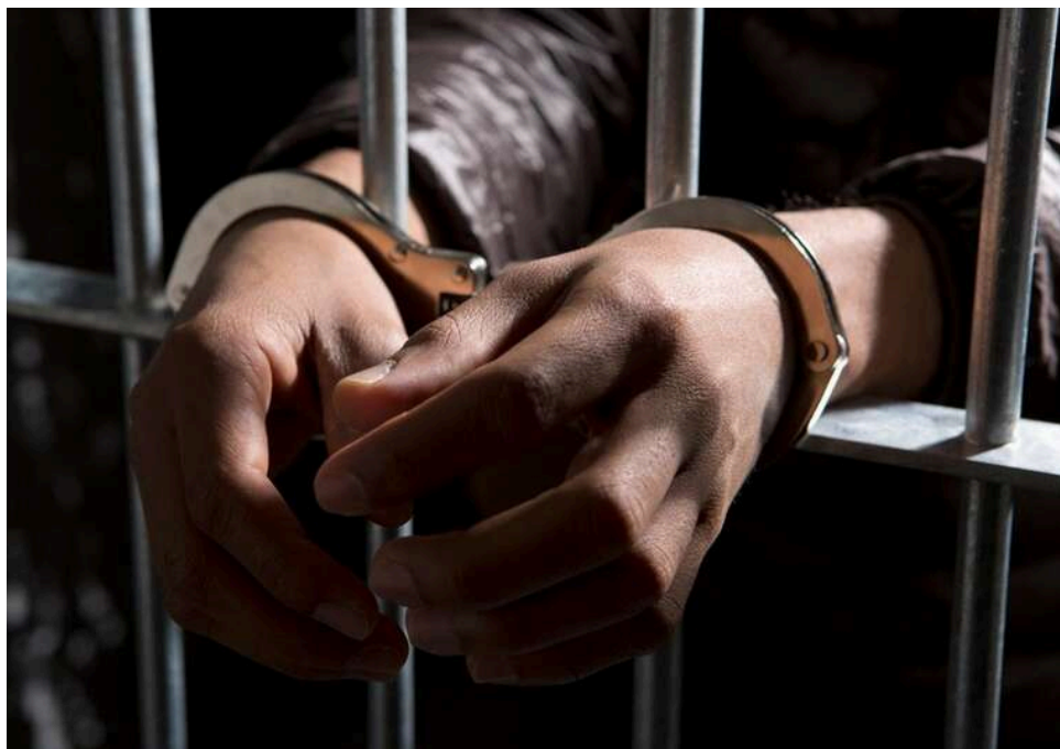
У Тернополі військовослужбовця засудили за ножове поранення військовозобов'язаного під час конфлікту

Тернопільський міськрайонний суд Тернопільської області ухвалив вирок у кримінальному провадженні за обвинуваченням військовослужбовця 3-го центру рекрутингу Військово-Морських Сил Збройних Сил України, сержанта-менеджера 3-ї категорії відділення комплектування та міжнародного співробітництва, у вчиненні кримінального правопорушення, передбаченого частиною першою статті 121 Кримінального кодексу України (умисне тяжке тілесне ушкодження).