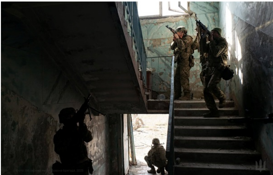
Українські захисники відбивають ворожі атаки

Найбільш гаряче з початку доби 11 квітня було на Костянтинівському та Покровському напрямках, повідомляють у Генштабі.