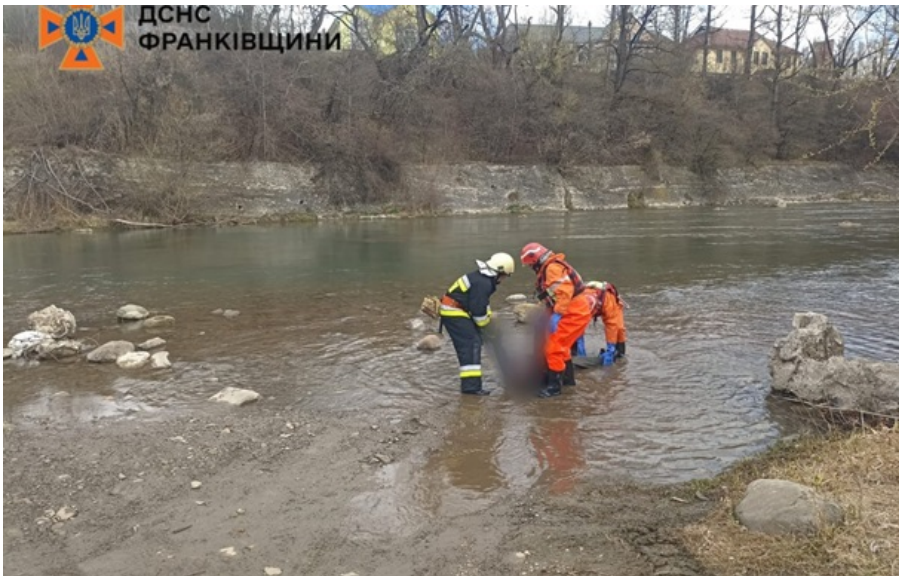
З річки Черемош дістали тіло місцевого жителя

Трагедії сталися в селі Глібівка Вишгородського району Київщини і в селищі Верховина Івано-Франківської області.