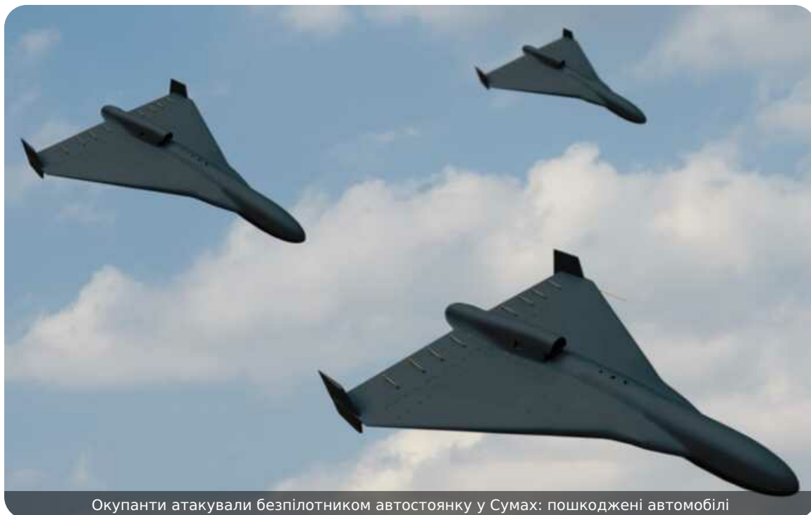
Окупанти атакували безпілотником автостоянку у Сумах: пошкоджені автомобілі

Сьогодні, 27 квітня, росіяни здійснили атаку безпілотником по автостоянці в місті Суми. Пошкоджено 15 вантажівок і 2 автобуси.