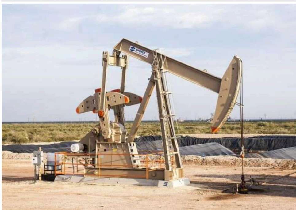
Goldman Sachs: Ціна нафти Brent у разі кризи може зрости до 120 доларів за барель