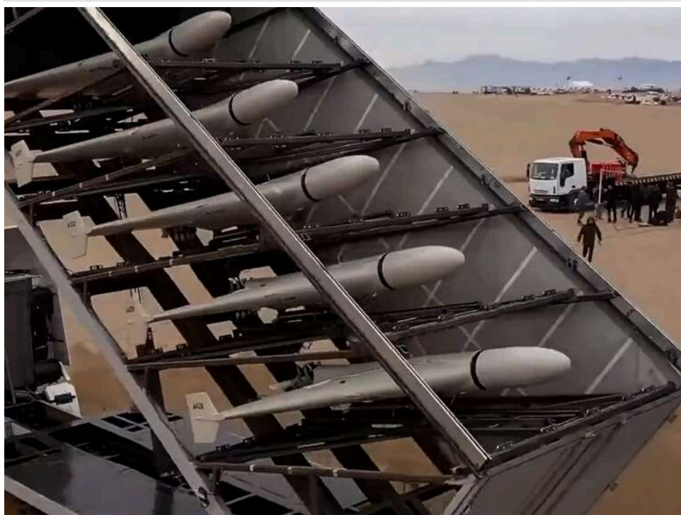
Новий полігон для «шахедів»: окупанти розбудовують капітальну базу в Орловській області

Російські окупанти зводять новий майданчик для запуску дронів-камікадзе типу Shahed. Об'єкт знаходиться поблизу села Цимбулова, приблизно за 170 км від українсько-російського кордону.