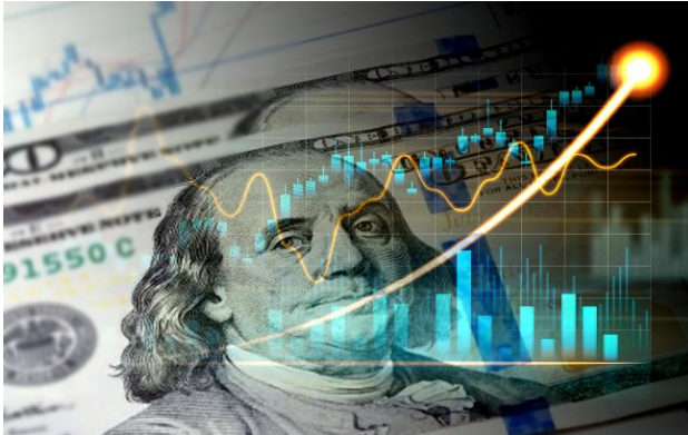
Фото: обмінники та банки оновили курс валют (Getty Images)

Ранок понеділка, 27 квітня, приніс неоднозначні новини на валютному ринку України. Поки долар демонструє відносну стабільність в обмінниках, у касах найбільших банків, зокрема ПриватБанку, курс пішов угору.