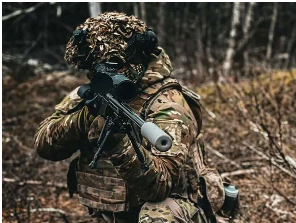
ЗСУ перевершують провідні армії світу: В NYT про нову роль України в архітектурі глобальної оборони

Україна все виразніше позиціонує себе як ключовий гравець у сфері безпеки та оборони. Її значення в сучасному світі виходить далеко за межі локального конфлікту, формуючи нову геополітичну реальність.