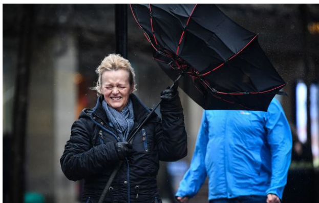
Фото: синоптик дала прогноз погоди в Україні на 27 квітня

В Україні сьогодні, 27 квітня, погода суттєво не зміниться. Дощі з мокрим снігом та штормовий вітер знову накриють низку регіонів.