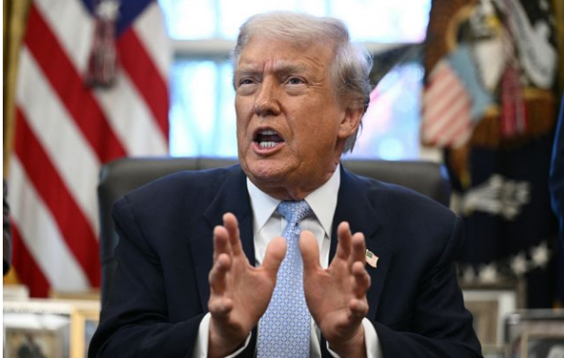
Фото: Дональд Трамп (Getty Images)

Президент США Дональд Трамп заявив, що він не ґвалтівник, чим категорично відкинув твердження, що містилися в "маніфесті" того, хто стріляв на вечері.