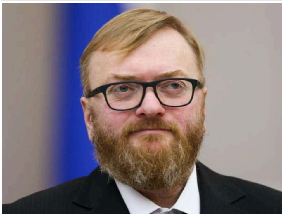
«Іди нах*й»: депутата "Єдиної Росії" Мілонова грубо вилаяли під час виступу на премії «Шансон року»

Депутата Віталія Мілонова нецензурно послали на церемонії вручення премії «Шансон року». Депутат вийшов на сцену разом із співаком Михайлом Шуфутинським.