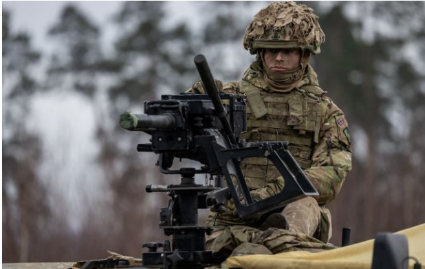
Фото: рішення поки що не ухвалено (Getty Images)

Уряд Британії розглядає плани зі створення "оборонного банку" для переозброєння своїх північноєвропейських союзників проти Російської Федерації.