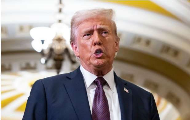
Фото: Дональд Трамп (Getty Images)

Президент США Дональд Трамп заявив, що в Ірану залишилося близько трьох днів до того моменту, як нафтова інфраструктура країни вибухне.