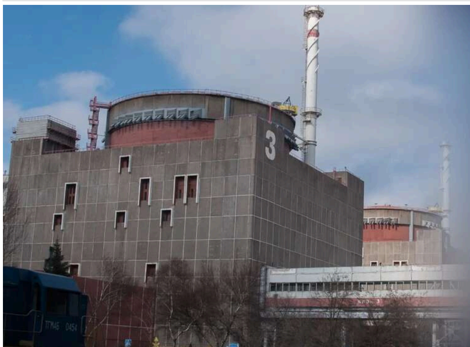
На ЗАЕС стався черговий блекаут через відключення лінії «Ферославна-1»

Сьогодні, 26 квітня, Запорізька атомна електростанція знову перебувала у блекауті.