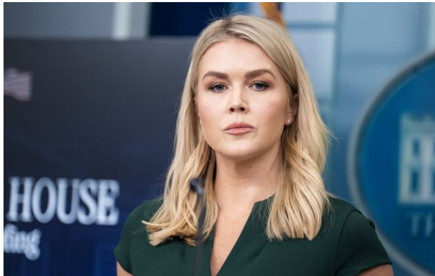
Фото: Керолайн Левітт (Getty Images)

Прес-секретар Білого дому Керолайн Левітт заявила, що підозрюваний стрілець, який увірвався вночі на вечерю, мав намір відкрити вогонь по президенту США Дональду Трампу і чиновникам адміністрації.