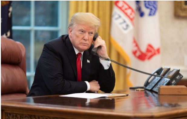
Фото: Дональд Трамп (flickr.com)

Президент США Дональд Трамп заявив, що продовжує регулярні переговори з главою Кремля Володимиром Путіним і президентом України Володимиром Зеленським щодо завершення війни.