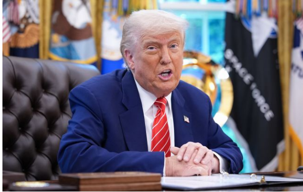
Фото: Дональд Трамп (Getty Images)

Президент США Дональд Трамп заявив, що спроба замаху минулої ночі ще раз підтвердила необхідність будівництва "захищеного" бального залу в Білому домі.