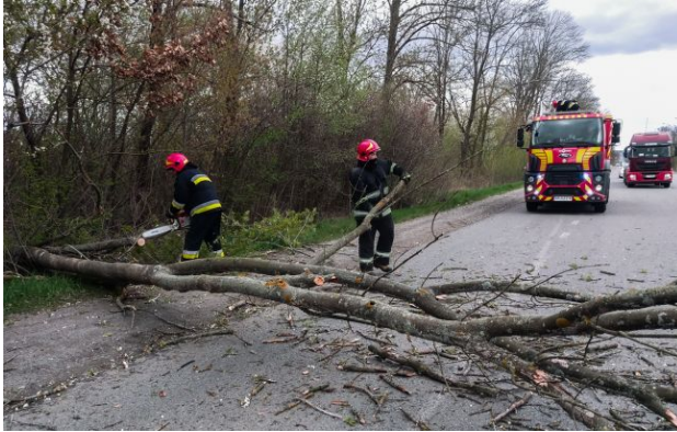
Фото: наслідки негоди в Україні 26 квітня (t.me/dsns_telegram)

Внаслідок негоди в Україні загинули двоє людей, ще двоє отримали поранення. Рятувальники продовжують ліквідовувати наслідки стихійного лиха у 13 областях країни.