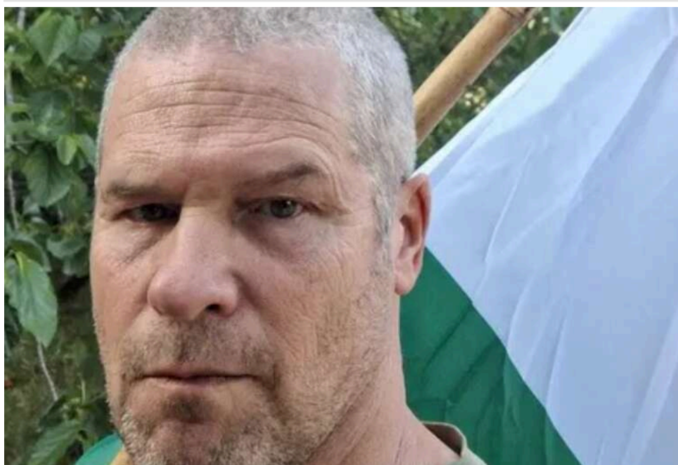
В Ізраїлі на протесті поліція тимчасово вилучила угорський прапор через побоювання плутанини із символікою

В Ізраїлі під час антиурядового протесту поліція вилучила угорський прапор у одного з учасників демонстрації. Правоохоронці пояснили свої дії тим, що його можна сплутати з палестинським і це нібито могло спричинити провокації.