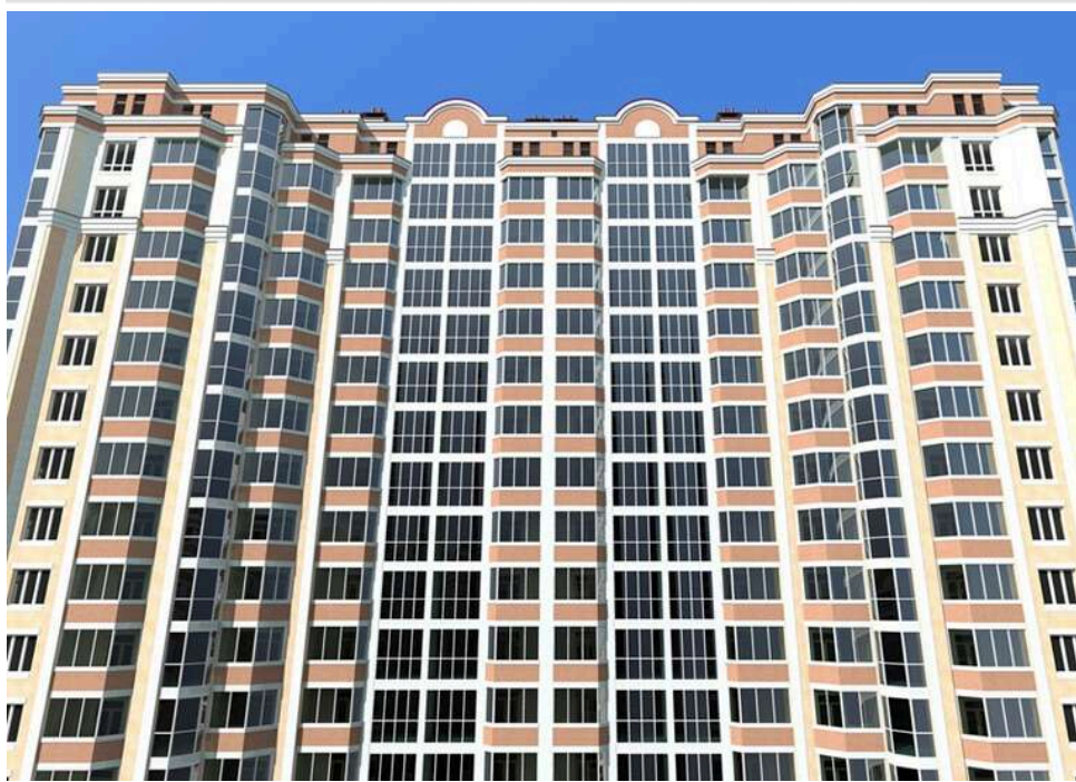
"Третій рік без опалення": мешканці ЖК "Сяйво2" в Ірпені протестують проти свавілля забудовника

У Ірпені на Київщині мешканці ЖК вийшли протестувати проти свавілля власного ж забудовника. Виявилось, що він вже третій рік поспіль не підключає у їхньому зданому будинку котельню. Відмовки кожного разу різні, втім, зрозуміло, що бізнесмени не хочуть витратитися на закупівлю трансформаторної підстанції та укладення договорів із компанією-постачальником електроенергії.