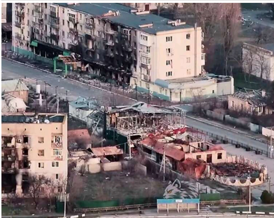
В окупованих Олешках заблоковано дві тисячі людей, серед них – 50 дітей: ситуація критична

У тимчасово окупованих Олешках Херсонської області близько 2000 цивільних осіб залишаються відірваними від зовнішнього світу.