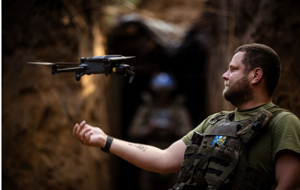
Фото: оператор дрона (Getty Images)

Українські ударні дрони вперше дісталися до Уралу та атакували Єкатеринбург і Челябінськ, подолавши до 1800 кілометрів у глибокий тил Росії.