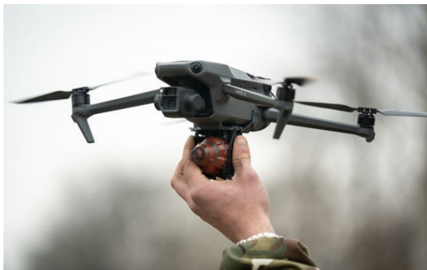
Фото: український дрон (Getty Images)

Бійці Угрупування об'єднаних сил атакували дронами мотоциклетну групу росіян, які намагались прорватись крізь лінію фронту.