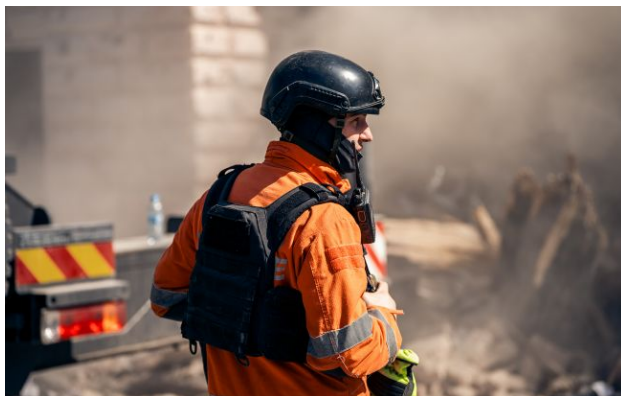
Фото: рятувальник ДСНС (Getty Images)

Після нічної атаки Росії Дніпро зазнав серйозних руйнувань, постраждали житлові будинки та об'єкти інфраструктури, є поранені та загиблі.