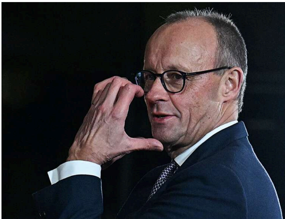
Фрідріх Мерц закликає до посилення тиску на Тегеран: Іран просто «тягне час» у переговорах

Канцлер Німеччини Фрідріх Мерц заявив про необхідність посилити міжнародний тиск на Іран, відзначивши, що Тегеран, за його оцінкою, «тягне час» у переговорах, а перспектива угоди залишається віддаленою.