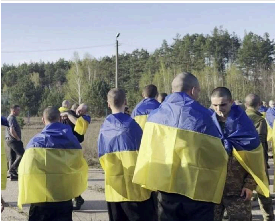
«Побачу і вперше візьму на руки»: боєць, який провів три роки в полоні, нарешті зустрінеться з сином

“Моєму дитинчаті буде 3 роки... і нарешті побачу і потримаю його на руках”, - український військовий, який після полону вперше зустрінеться зі своїм малюком.