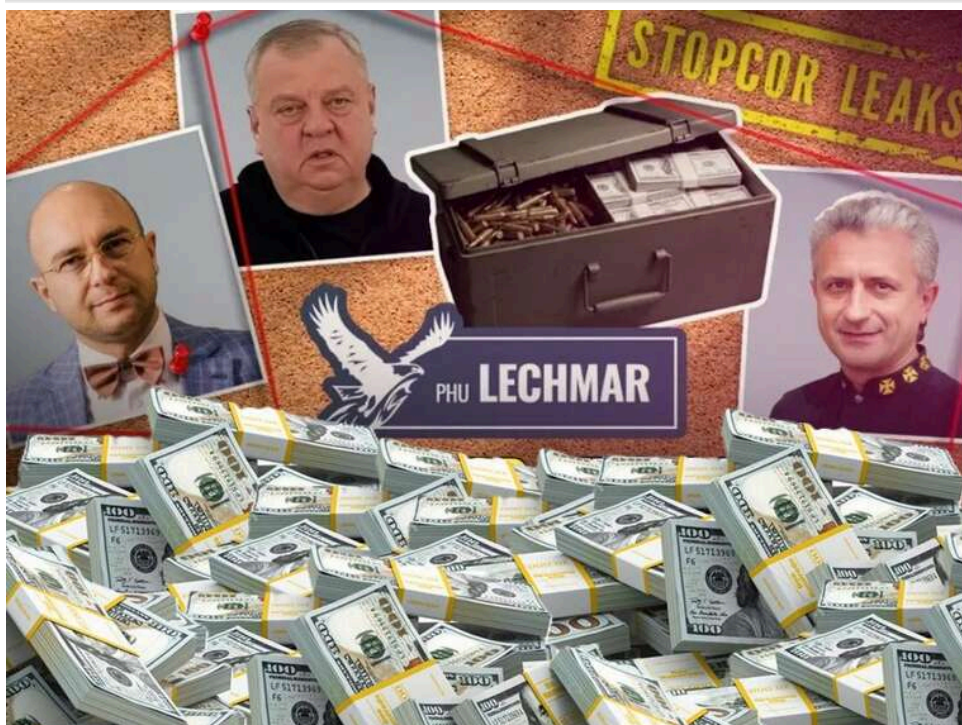
Від «Арсеналу» до «Лехмара»: як одна мережа посередників вивела 24,5 мільярда на закупівлях зброї