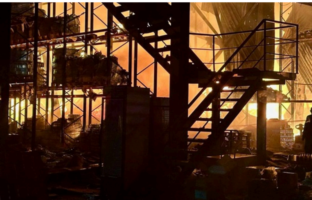
Внаслідок обстрілу пошкоджені склади з продуктами харчування в Дніпрі

Кількість поранених зросла до п'яти - всі госпіталізовані; двос з них перебувають у важкому стані.