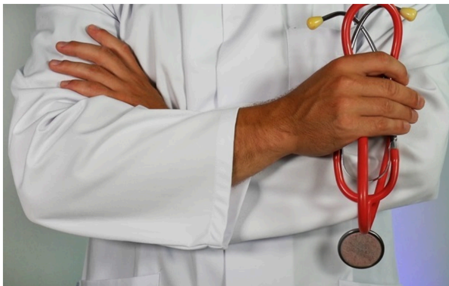
Фото: Unsplash (ілюстративне фото) В Австралії зафіксовано спалах дифтерії

Найбільше спалах зачепив представників корінного населення. Госпіталізують близько третини хворих.