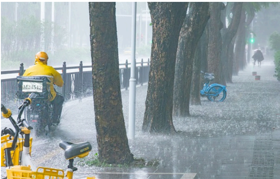
У Китаї тривають потужні зливи

За офіційними даними, щонайменше 21 людина загинула внаслідок повеней і зсувів.