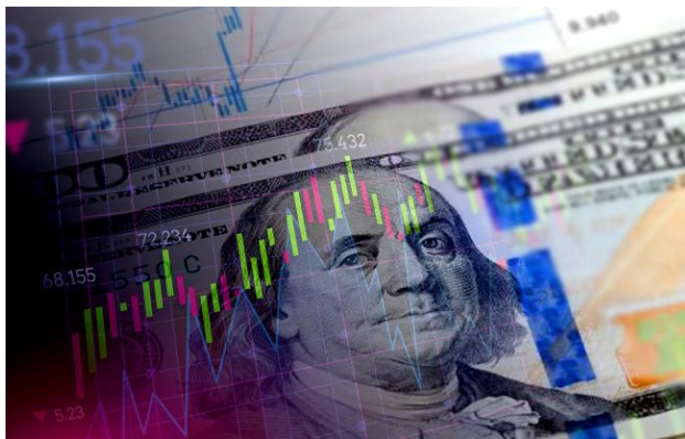
Фото: НБУ оновив офіційний курс валют (Getty Images)

Національний банк України встановив офіційний курс валют на понеділок, 27 квітня. Долар демонструє поступове зміцнення, тоді як євро після просідання напередодні знову дорожчає.