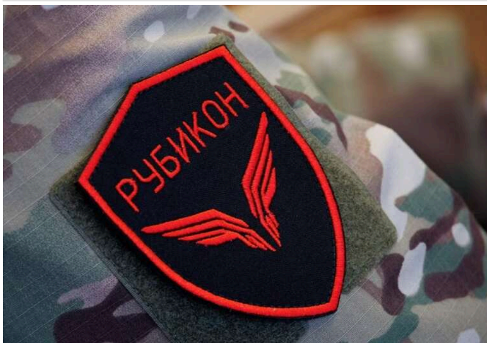
Загроза вглиб тилу ЗСУ: військовий проаналізував нову тактику та можливості російського підрозділу «Рубікон»

Дрони російського підрозділу «Рубікон» все активніше працюють у глибокому тилу ЗСУ, діючи цілодобово. Крім того, вони здатні перехоплювати українські безпілотники, в тому числі далекобійні, що в перспективі може ускладнити удари по російських тилкових об'єктах.