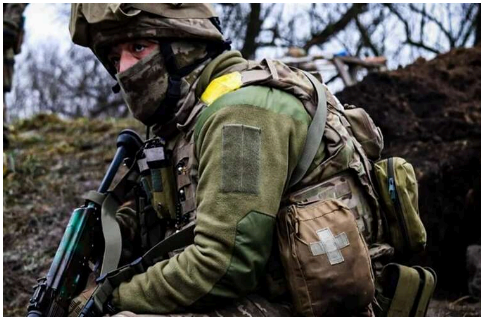
Ситуація на фронті: за добу сталося 236 бойових зіткнень по всій лінії фронту

Розпочалася 1546-а доба широкомасштабної збройної агресії РФ проти України. Загалом протягом минулої доби зафіксовано 236 бойових зіткнень.