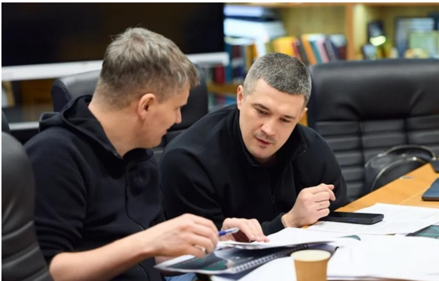
Партнерам буде представлено пріоритетні напрямки співпраці, повідомили в Міноборони

Україна готує до наступного засідання оновлення щодо реалізації пунктів Плану війни для примусу Росії до миру.