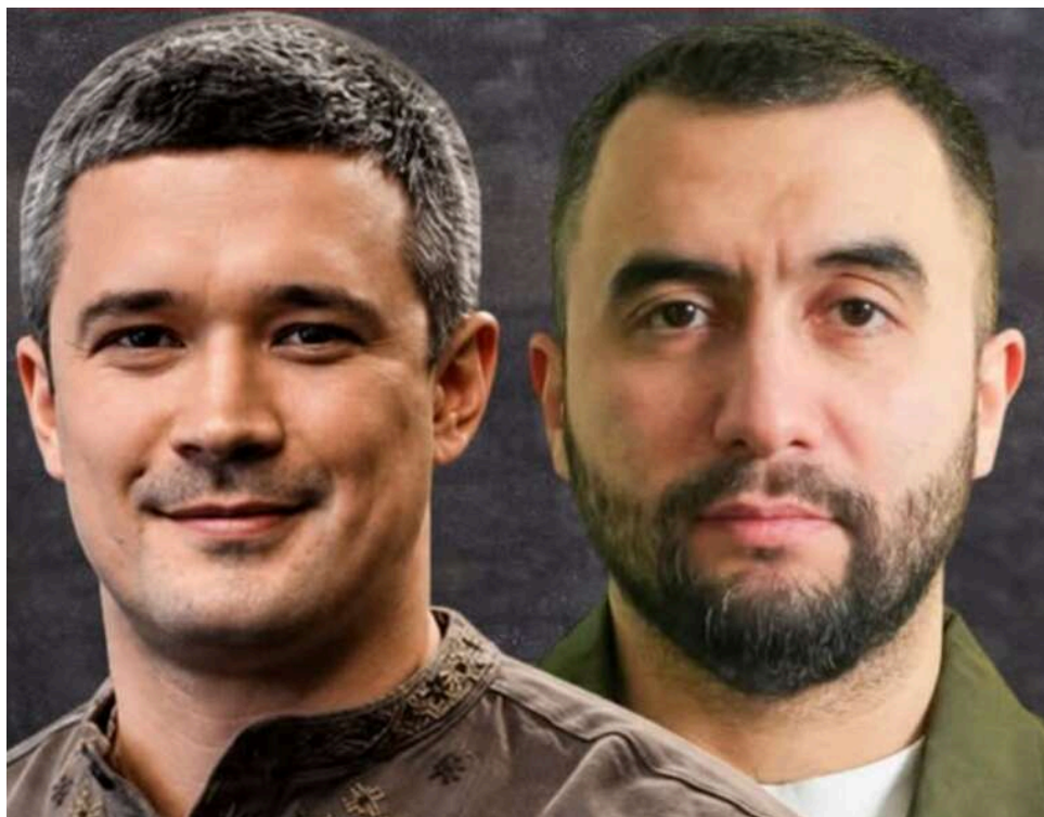
Мільярдні контракти, «дірка» у 18 мільярдів та купівля ЗМІ: як «Вирій Індастрі» монополізує ринок FPV-дронів

Поки ринок FPV-дронів концентрується в одних руках, власник «ВИРІЙ ІНДАСТРІ» купує 75% «Бабель» за 1 млн доларів при статутному капіталі 200 тис. грн. Угода виглядає непропорційною, враховуючи реальну структуру активу і його фінансові показники. Це відбувається паралельно з отриманням мільярдних оборонних контрактів і контролем над сегментом оптоволоконних FPV. У підсумку один і той самий гравець акумулює виробництво, бюджетні потоки та медійний ресурс.