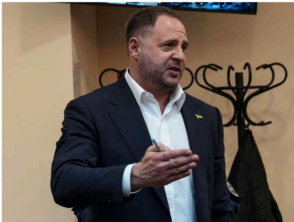
14 мільйонів від засудженого за хабар екссБУшника Марфіна: хто дав гроші на заставу для Єрмака

Одним із заставодавців Єрмака став колишній співробітник СБУ, засуджений за отримання хабаря.