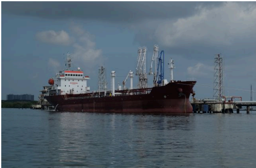
Фото: нафтовий танкер