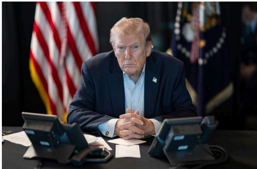
Фото: президент США Дональд Трамп