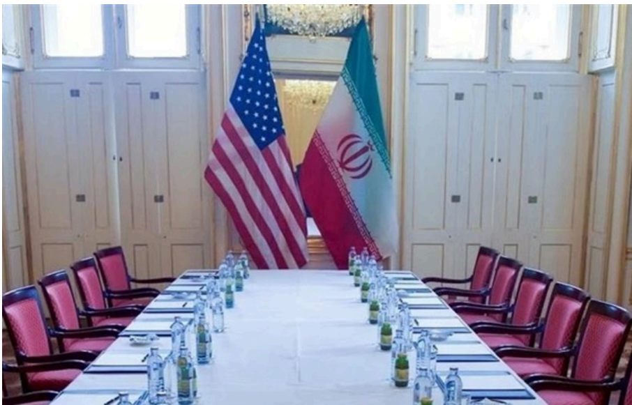
США і Іран ведуть складні переговори

Іранська пропозиція щодо врегулювання конфлікту передбачає повне скасування всіх санкцій США, стверджують джерела.