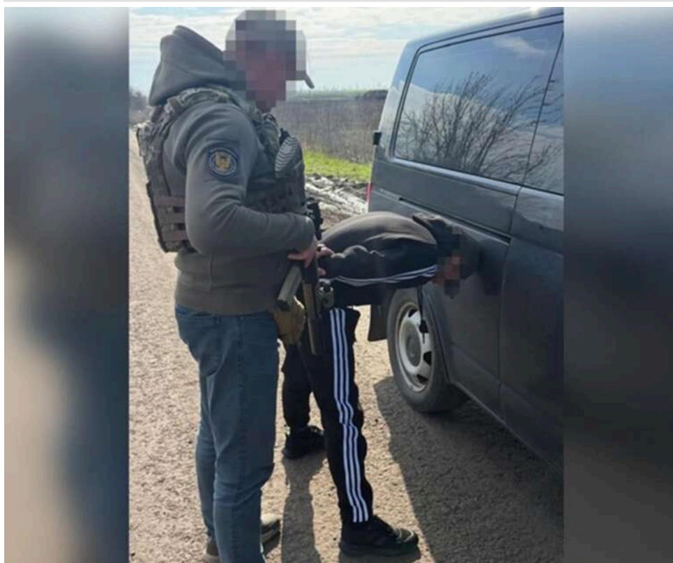
Довічне за лояльність окупантам: у Вінниці судитимуть інформатора "вагнерівців", який здавав позиції ЗСУ у Дружківці

Слідчі СБУ у Вінниці викрили 27-річного мешканця Дружківки, який самотужки став агентом противника. Він передавав координати позицій Збройних Сил України куратору з ПВК «Вагнер», чим сприяв окупантам у коригуванні обстрілів прифронтового міста.