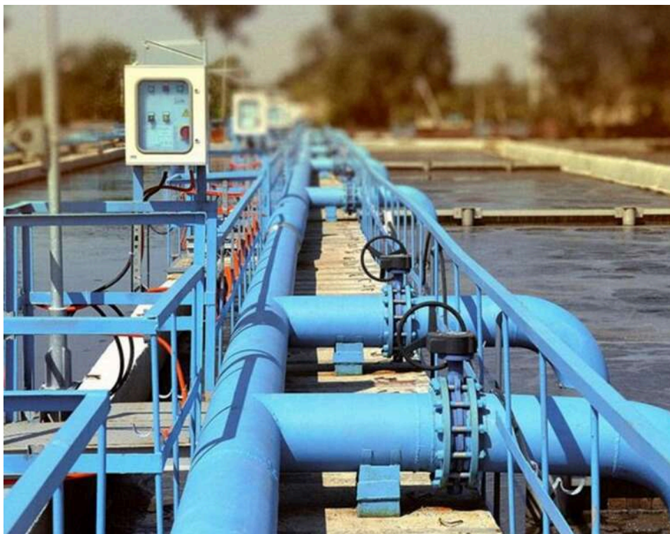
Переплата на чверть і польські посередники: «Дніпро-Західний Донбас» закупив хімії для очищення води на 33 мільйони

Державне міжрайонне підприємство водопровідно-каналізаційного господарства «Дніпро-Західний Донбас» Дніпропетровської ОДА 14 квітня за результатами тендеру замовило ТОВ «Зовнішагротранс-1» хімії на 32,91 млн грн.