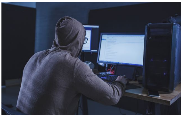
Фото: в Україні викрили казино з оборотом на мільярди гривень

Офіс Генерального прокурора викрив мережу нелегальних онлайн-казино з оборотом у 5 млрд гривень, серед організаторів – громадяни РФ.