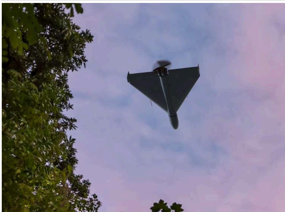
Повітряні сили ЗСУ: Росія атакує Україну дронами з кількох напрямків

Російська армія атакує територію України за допомогою ударних безпілотників увечері 17 травня.