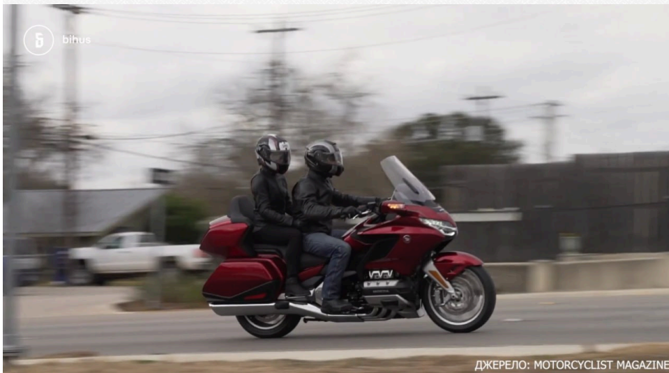
Honda GL 18000 Gold Wing