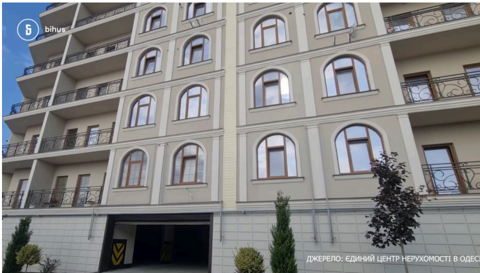
Клубний будинок "Авіньйон"