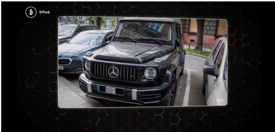
Mercedes-Benz G63 AMG