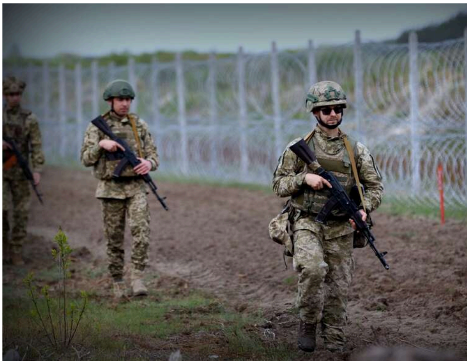
ЗСУ: Ознак підготовки нового наступу РФ з території Білорусі наразі немає

Наразі немає явних ознак підготовки військ РФ до нового наступу на Україну з боку Білорусі.