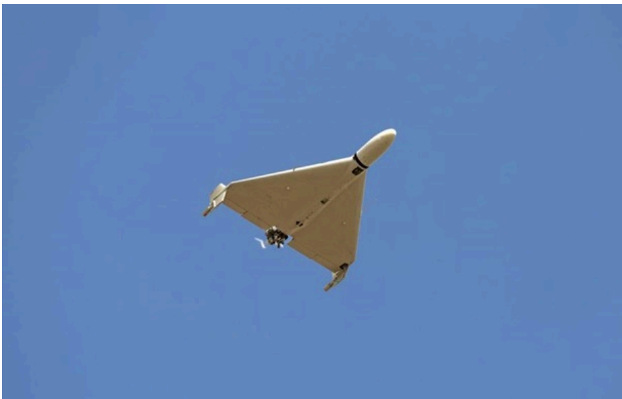
Російські дрони атакували Київську область