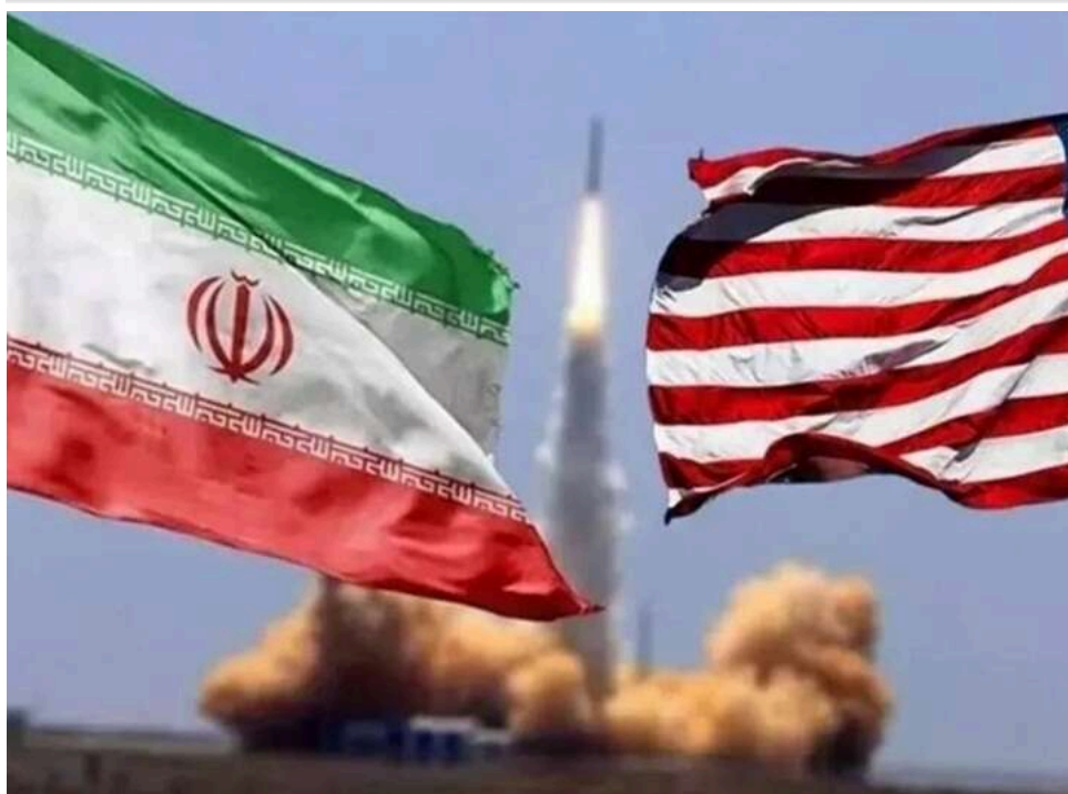
Ультиматум Трампа: США висунули Ірану 5 жорстких умов під загрозою масштабної війни

Світ опинився на порозі чергової масштабної ескалації на Близькому Сході. Адміністрація президента США Дональда Трампа перейшла до мови жорстких ультиматумів, висунувши Тегерану п'ять безкомпромісних умов для продовження процесу врегулювання. Водночас сам Трамп та американські медіа відкрито натякають на можливість відновлення масованих бойових дій уже найближчими днями.