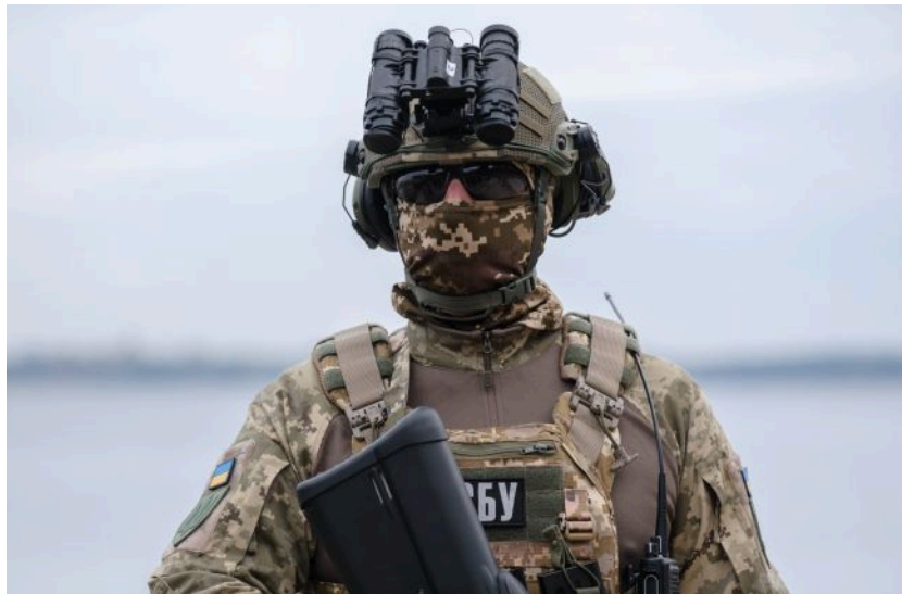
Фото: СБУ розкрила деталі атак на Москву та Крим (Віталій Носач, РБК-Україна)