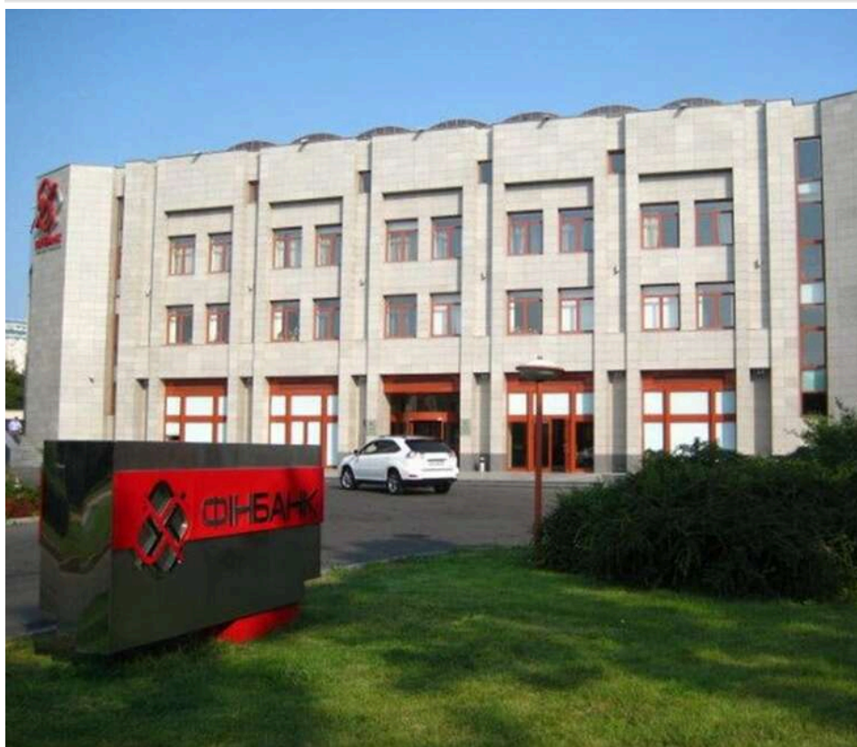
Мінус 102 мільйони для бюджету: суд закрив справу ексголови "Фінбанку" Кауфмана через сплив строків давності

Суд закрив кримінальне провадження щодо колишньої тимчасово виконуючої обов'язки голови правління ПАТ «Фінбанк» олігарха Кауфмана Людмили Зотєєвій (Зотеевой) через закінчення строків давності.